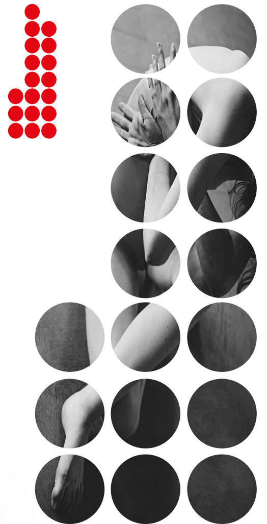
«Dentelle dans la matrice» © Vanessa Moselle

Facebook : 29x27/septcentquatrevingt Trois