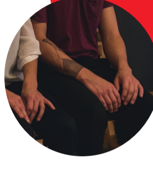
Les petits duos de la nuit

29.27 mène le projet SEPT CENT QUATRE VINGT TROIS qui, de par ses murs, abrite durablement les productions des compagnies en création ; accueille les pratiquants de la danse et invite tout spectateur curieux à découvrir la diversité du travail d'artiste.